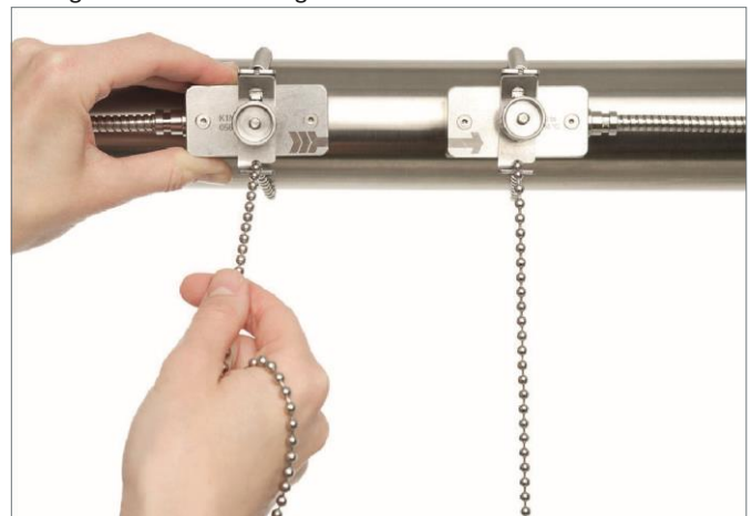
Sensoren aan buitenzijde bevestigd met kettingen en klemmen