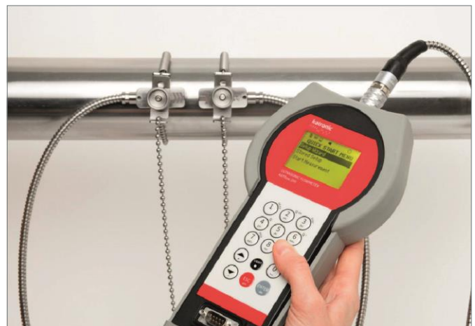
KATflow in werking